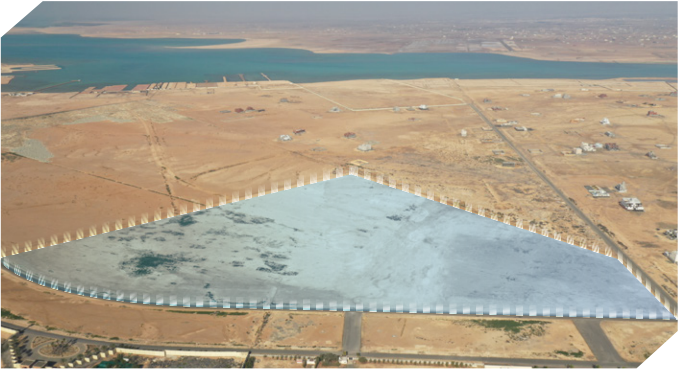
تحديد العقار تقريبي والأساس ما تم ذكره في الصك