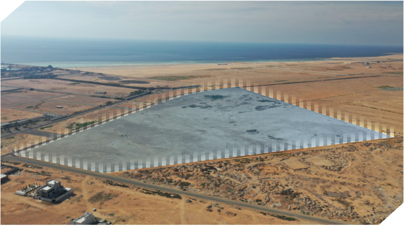
تحديد العقار تقريبي والأساس ما تم ذكره في الصك